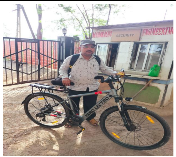
Use of Bicycles/ Battery powered vehicles