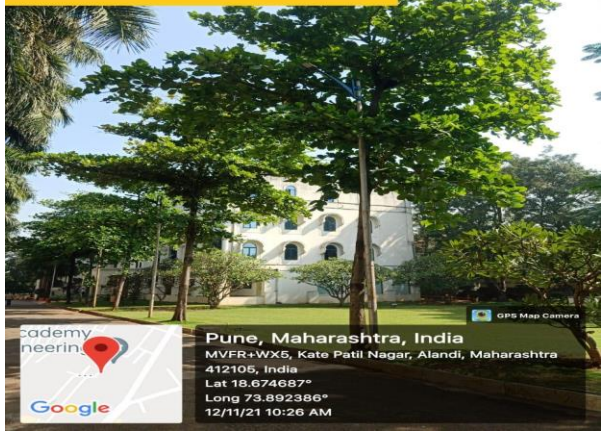
Almond Plant, D wing front, MIT AOE Alandi Pune.

Pune, Maharashtra, India MVFR+WX5, Kate Patil Nagar, Alandi, Maharashtra 412105, India Lat 18.674687° Long 73.892386° 12/11/21 10:26 AM