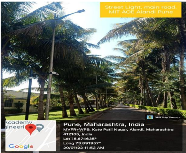
Street Light, main road, MIT AOE Alandi Pune

Pune, Maharashtra, India MVFR+WP9, Kate Patil Nagar, Alandi, Maharashtra 412105, India Lat 18.674635° Long 73.891957° 20/01/22 11:52 AM