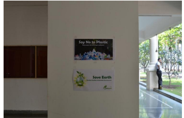
Ban on use of plastic