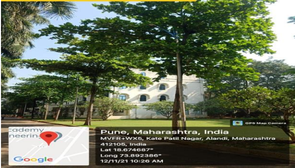
Almond Plant, D wing front, MIT AOE Alandi Pune.

Pune, Maharashtra, India MVFR+WX5, Kate Patil Nagar, Alandi, Maharashtra 412105, India Lat 18.674687° Long 73.892386° 12/11/21 10:26 AM