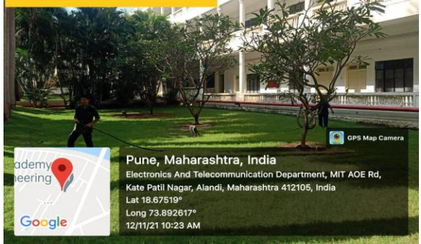
Plumeria Tree, A wing front, MIT AOE Alandi Pune.

Pune, Maharashtra, India Electronics And Telecommunication Department, MIT AOE Rd, Kate Patil Nagar, Alandi, Maharashtra 412105, India Lat 18.67519° Long 73.892617° 12/11/21 10:23 AM